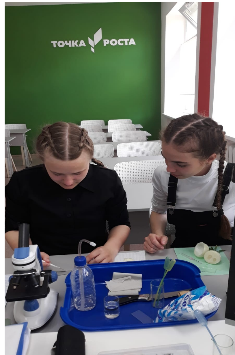
На занятиях по внеурочной деятельности « Практическая биология» 8 класс с использованием Цифровой лаборатории. Лабораторная работа «Плазмолиз и деплазмолиз в растительной клетке»