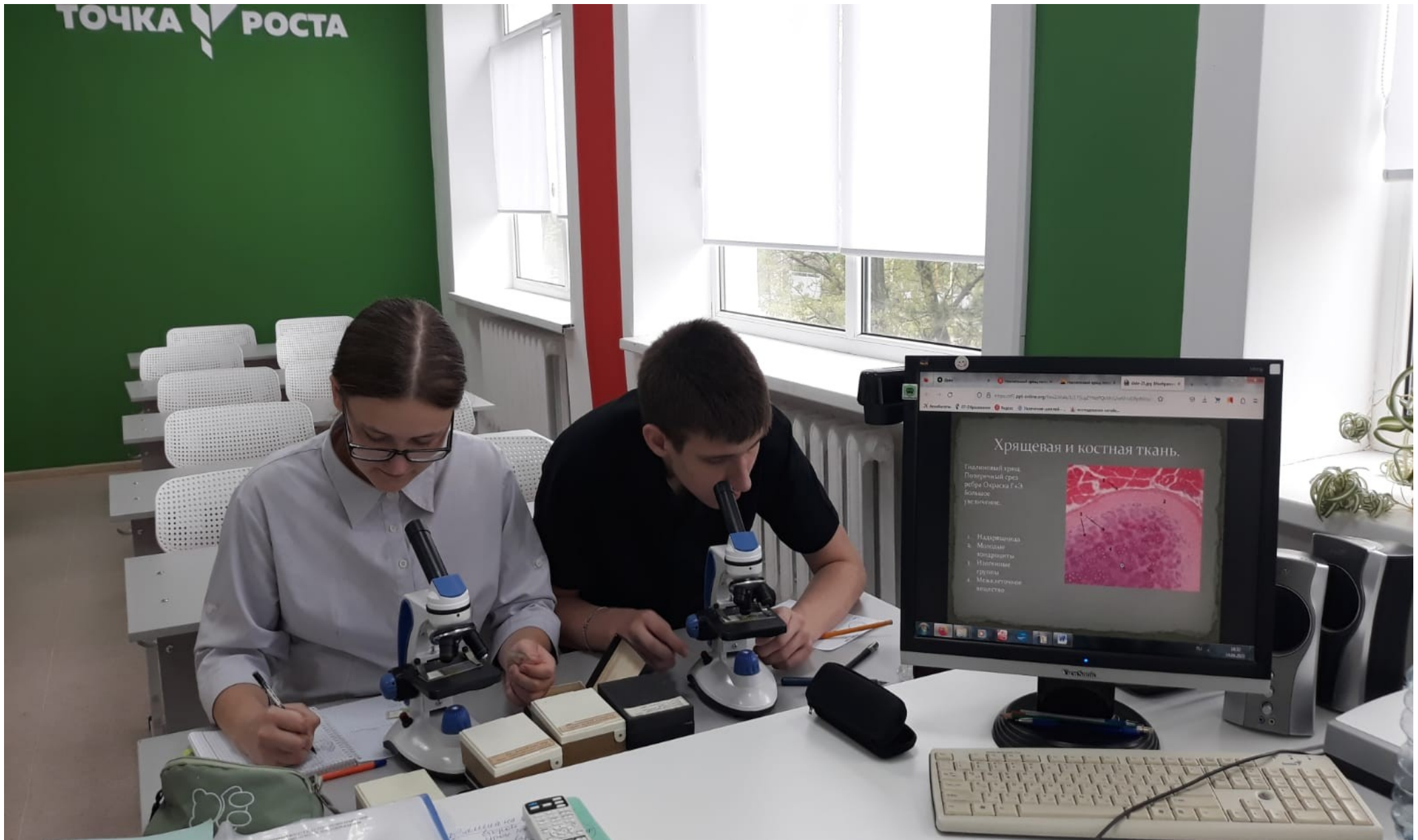
На занятиях по внеурочной деятельности «Практическая биология» 8 класс с использованием Цифровой лаборатории. Лабораторная работа «Ткани человека»