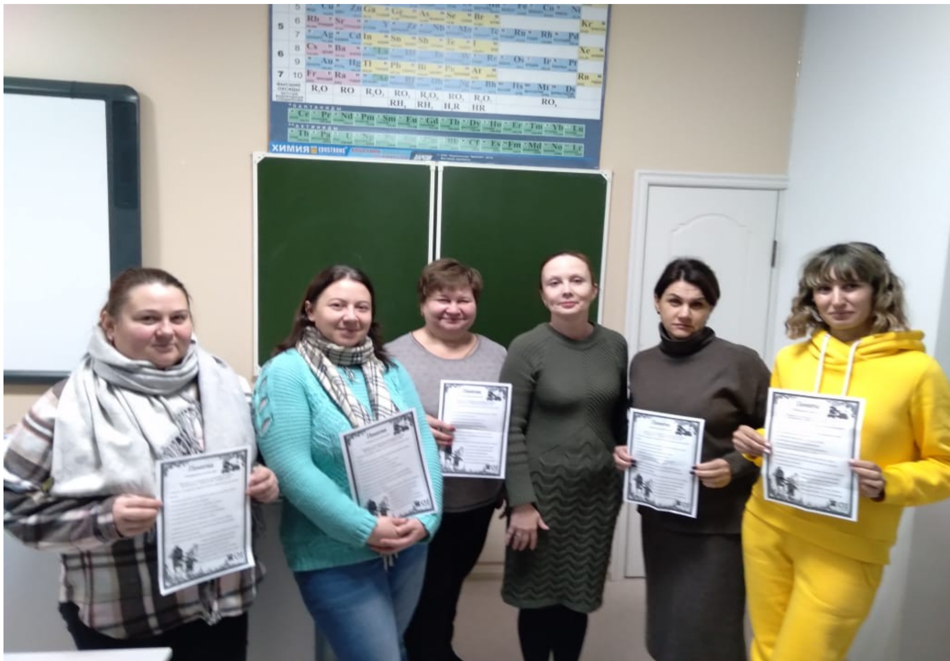
Родительское собрание в 7б классе «Безопасность детей»